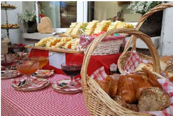
Ein reichhaltiges Buffet am 1. August-Brunch.

Der 1. August-Brunch ist seit Jahren eine von der Bevölkerung geschätzte Tradition am Schweizer Nationalfeiertag. Wie beliebt er ist, zeigt sich dabei, dass die meisten Brunchs im Vorfeld bereits ausgebucht waren. Um den administrativen Aufwand im Vorfeld zu verringern, kam zum ersten Mal eine digitale Ti-