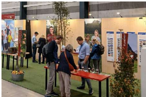
Die Quiz-Ecke ist bei Jung und Alt beliebt.

Auftrag des Zentral-schweizer Bauernbundes (ZBB) organisierte das Bauernsekretariat den Auftritt der Landwirtschaft. In der Quiz-Ecke konnten die Besucher ihr landwirtschaftliches Wissen in den Bereichen Tierhaltung, Mechanisierung und Pflanzenbau (Ackerbau) testen oder Neues dazu lernen. Das Interesse an