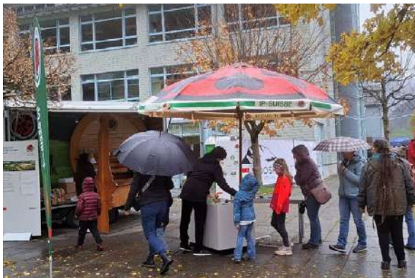
Am Muotathaler Alpkäsemarkt war IP-Suisse Schwyz wiederum mit einem Stand vertreten.

Die App Smartfarm hat sich nach verschiedenen Erweiterungen zu einem wertvollen Instrument für die notwendigen Aufzeichnungen entwickelt und wird laufend verbessert.