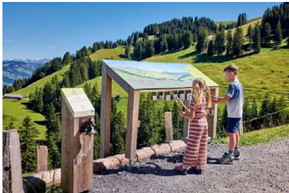
Glockenspiel an einer Station des Alperlebniswegs Rigi.

Die BVSZ unterstützt das Projekt Alpwirtschaft und Tourismus Kanton Schwyz, welches vom Alpwirtschaftlichen Verein des Kantons Schwyz gemeinsam mit Schwyz Tourismus lanciert wurde. Ziel des Projektes ist es, den Touristenstrom im Sömmerungsgebiet zu lenken, Verhaltensregeln aufzuzeigen, die Leistungen der Alpwirtschaft vorzustellen sowie den Absatz der Alpprodukte zu fördern. Im vergangenen Jahr wurde im Rahmen des Projekts der Alperlebnisweg Rigi eröffnet. Der Weg wurde bereits rege begangen, und auch die Webseiten, welche die Tätigkeiten der Älpler erläutern, wurden erfreulich oft angeklickt.