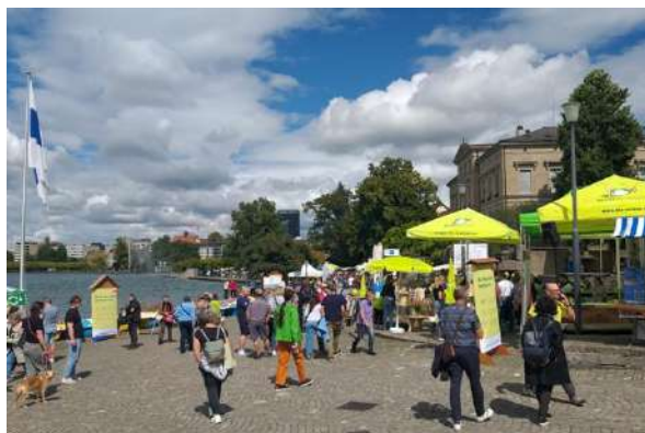
O Sole Biomarkt in Zug Ende August mit rund 50 Ausstellern.

Im Vergleich zu den letzten Jahren sind wenig Landwirtschaftsbetriebe in der Umstellung auf Bio, das hat auch Auswirkungen auf das Angebot auf dem Markt. Speziell gesucht werden Bio-Milch und Schweizer Knospe Weizen.