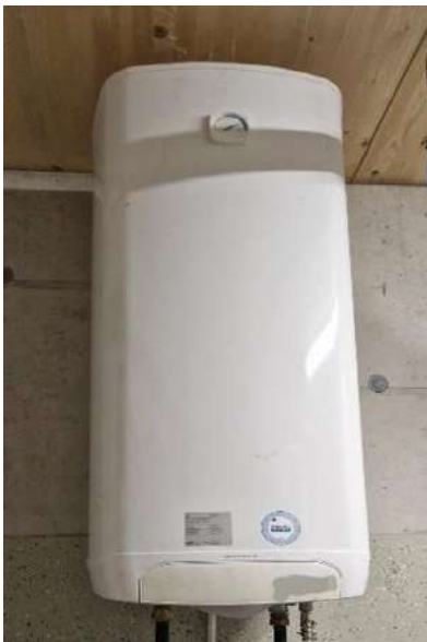
Bei der Warmwasseraufbereitung gibt es viel Energieeinsparpotential.

Im vergangenen Jahr 2025 hat das Projekt Agri-Peik richtig Fahrt aufgenommen. Die Energieberatung für landwirtschaftliche Betriebe, die darauf abzielt, Energie einzusparen und Betriebskosten zu senken, konnte erfolgreich etabliert werden. Insgesamt wurden 14 Beratungen durchgeführt – 9 Beratungen im Kanton Schwyz und 5 im Kanton Nidwalden.