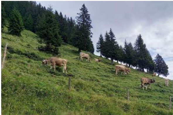
Die statische Waldgrenze schafft abschliessend und definitiv Klarheit zur Abrenzung zwischen Wald und Kulturland.

Die Bauernvereinigung sprach sich klar für die Schaffung einer statischen Waldgrenze aus und unterstützte entsprechend die Motion von Kantonsrat Samuel Lütolf, welche der Kantonsrat am 12. Februar 2025 angenommen hat. Die statische Waldgrenze bietet nicht nur langfristige Planungssicherheit für die Landwirtschaft, sondern