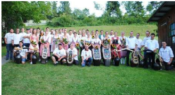
Die erfolgreichen Absolventinnen und Absolventen 2025

Am 4. Juli 2025 konnten 14 Landwirtinnen und 27 Landwirte das eidgenössische Fähigkeitszeugnis (EFZ) entgegennehmen. Traditionellerweise fand die Schlussfeier auf dem Lützelhof in Pfäffikon statt. Da in diesem Jahr so viele Absolventinnen und Absolventen die